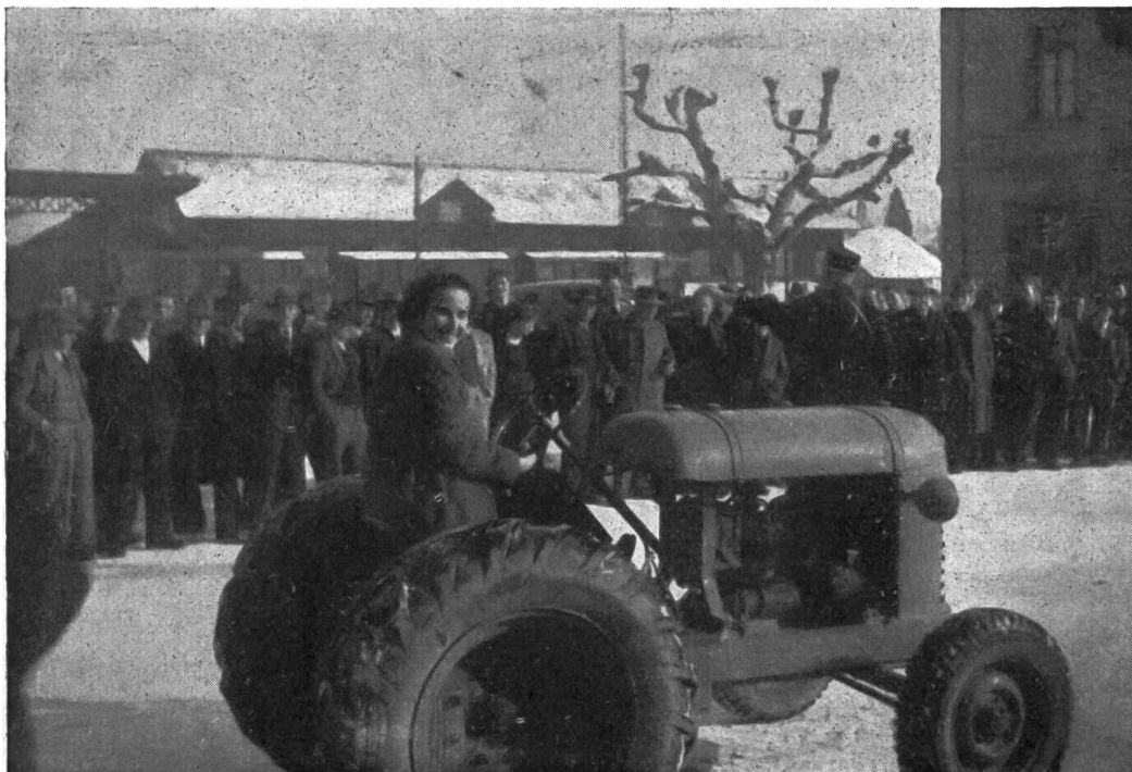
Ein Bravo der tapferen Traktorführerin !

Liegt hier etwa das Geheimnis der grossen Aufmärsche an den Kursen der Sektion Bern ? Kursberichten konnten wir entnehmen, dass die Sektion Schaffhausen dieses «Geheimnis» offenbar auch schon kennt. Sektionsgeschäftsführer merkt euch das !