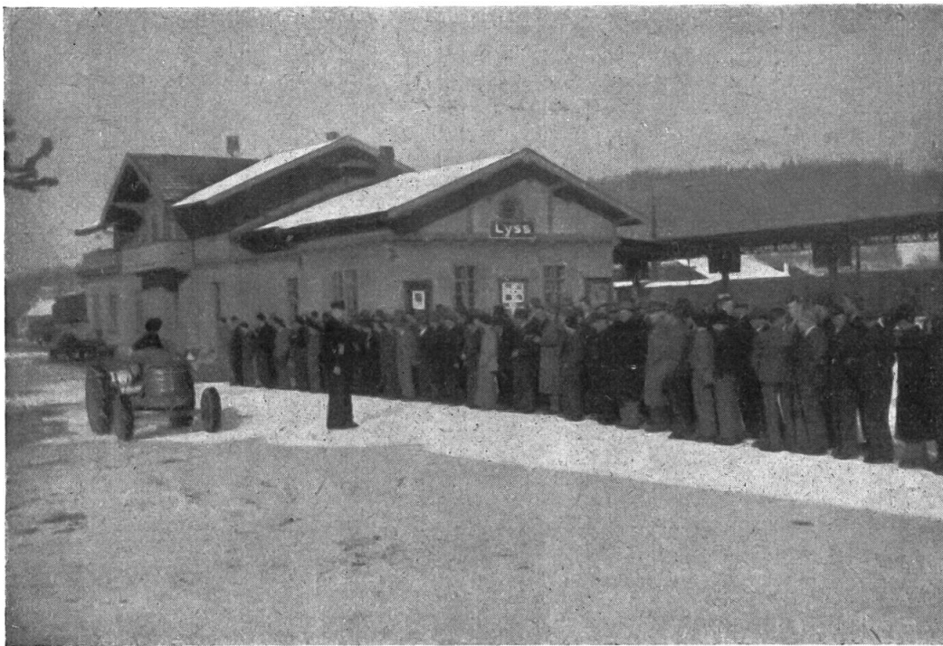
Aufnahme anlässlich eines Verkehrsausbildungskurses in Lyss. Als Kursleiter wirkte damals noch Pol. Wm. Hadorn.