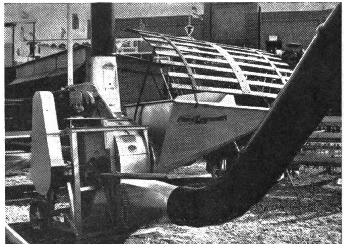
«Ley-Dreschturbine», Ansicht von der Antriebsseite