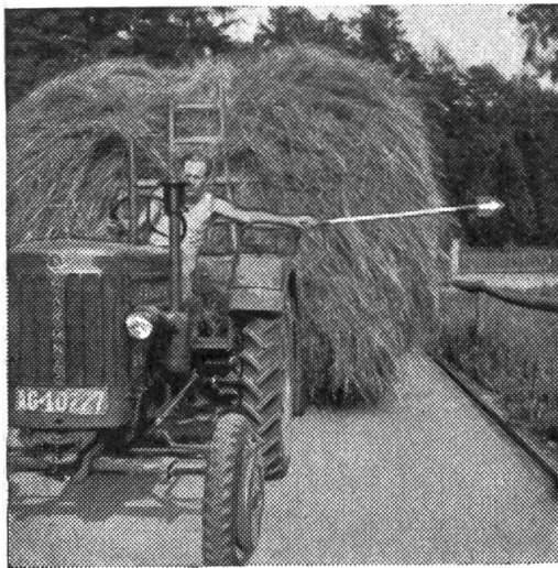
Traktorfürer mit Signalkelle (von vorn)

Das Abbiegen nach links mit voll beladenen Erntewagen kann auf einfachste Weise mit einer Signalkelle angezeigt werden.