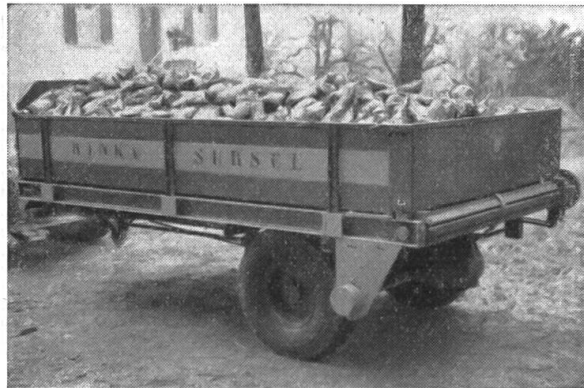
Anhänger mit automat. Abladen