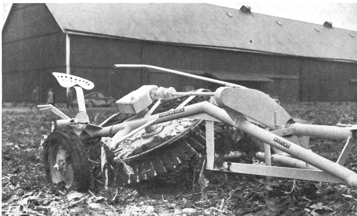
Abb. 2: Einreihiger und zapfwellengetriebener Rübenroder «Kaller».

ist, werden selbst lose und höher stehende Rüben sauber geköpft, ohne dass diese herausgerissen werden. Das Blatt wird durch einen Gummibandelelevator in einen Auffangkorb geleitet und wird von diesem in Stränge rechtwinkelig zur Fahrtrichtung abgelegt. Durch zwei vor dem Tastrad laufende Gleitschienen wird die Maschine in der Reihe gehalten und ist dadurch fast selbstführend. Der Preis beträgt 900.— skr. (skr. = Fr. 0.75).