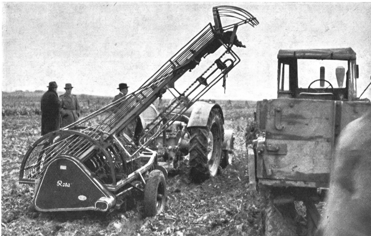
Abb. 1: Zweireihiger Rübenroder «Rota» mit Elevator.