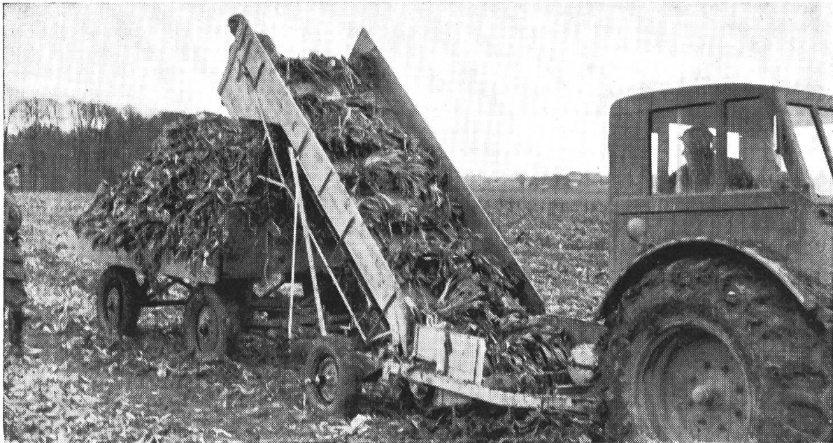
Abb. 5: Auflader für Blätter «Spragelse».

Auch diese Maschine hatte mit Reinigungsschwierigkeiten zu kämpfen und war durch Verstopfung der Reinigungstrommel oft zum Anhalten gezwungen. Unter normalen Verhältnissen dürfte die Maschine zufriedenstellend arbeiten, doch haben nachträglich Versuche ergeben, dass eine Reinigung der Rüben nur bei trockenen Verhältnissen und leichter Erde einwandfrei erfolgt (Preis 4,950 skr.).