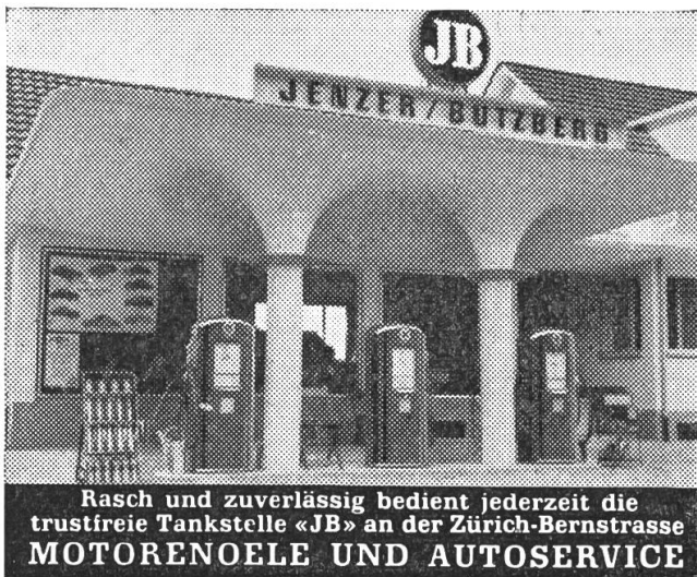
Rasch und zuverlässig bedient jederzeit die trustfreie Tankstelle «JB» an der Zürich-Bernstrasse MOTORENOELE UND AUTOSERVICE

Besucht an der MUBA den Stand 4460, Halle XIII der SERVA-TECHNIK AG.