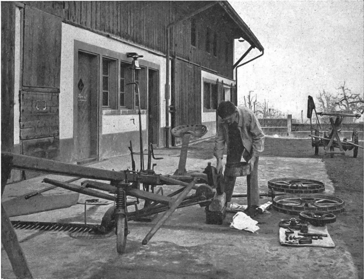
Gründliche Reinigung und Revision einer Mähmaschine am Strickhof/Zürich