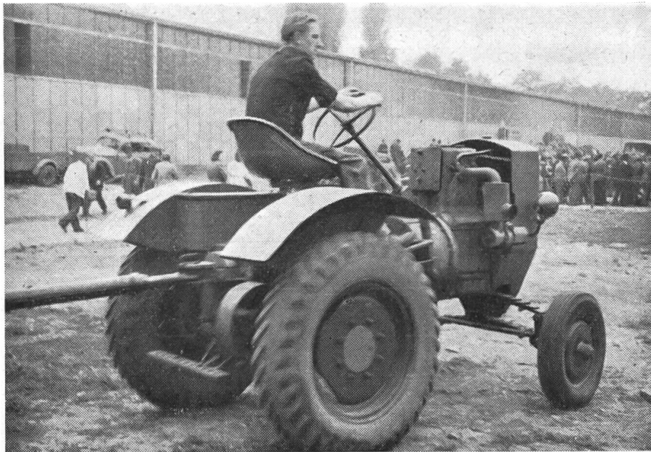
Geschicklichkeitsfahren mit Schlepper

grosse Geschicklichkeit, mit Pferd und Ackerwagen zwischen aufgestellten weissen Stäben Achterfiguren zu fahren oder mit Schlepper, Pflug und Egge zwischen bunten Fähnchen einen Slalomlauf zu veranstalten.