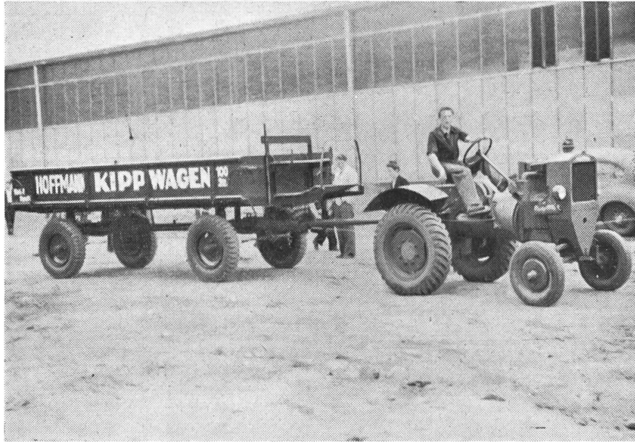
Vorführung von Ackerwagen