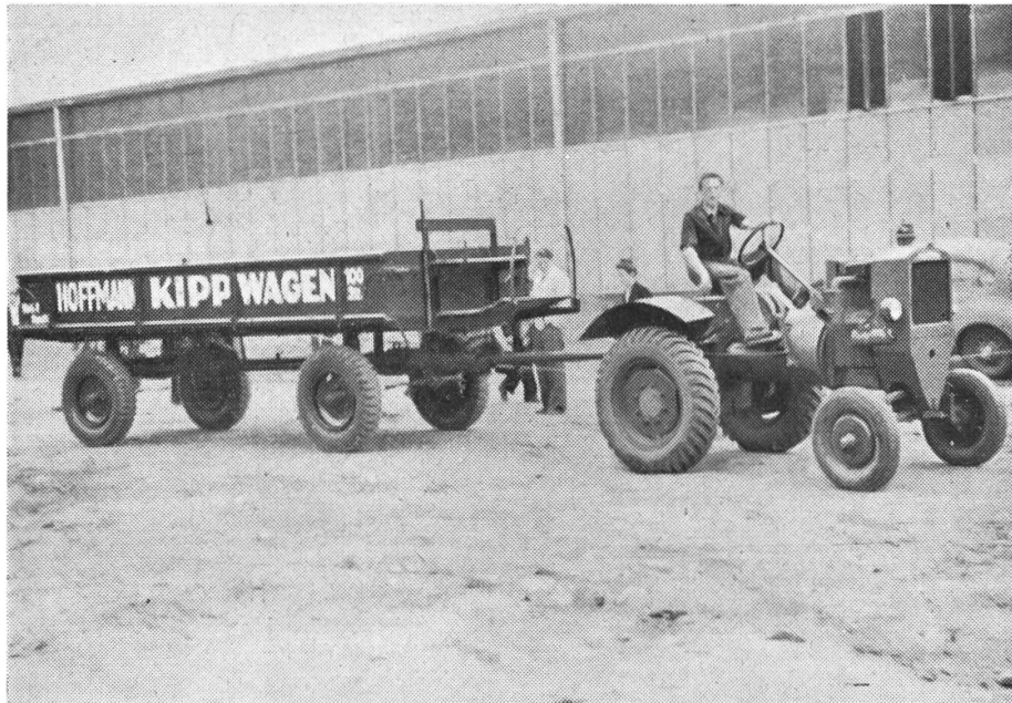
Vorführung von Ackerwagen