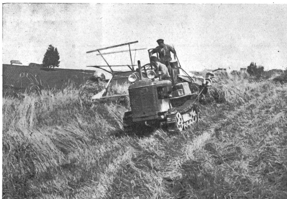
Erntearbeit am Berghang