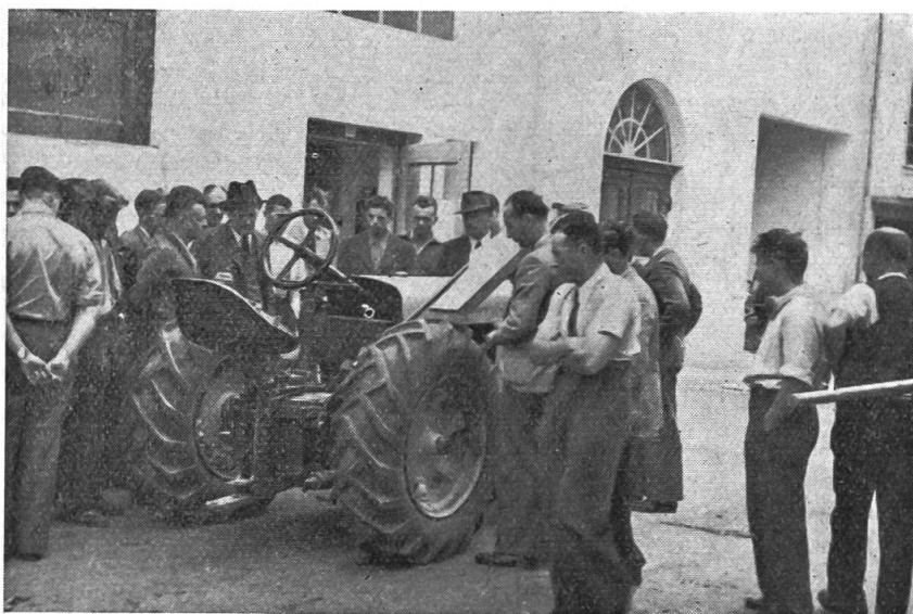
Vorführung eines Traktors