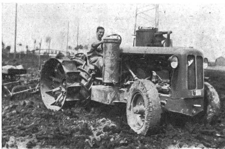
Spezialackerräder, total 120 cm breit

Mit der Typenprüfung bezweckt der interkantonale Ausschuss der Automobilexperten die Vereinheitlichung der im Motorfahrzeuggesetz (MFG) vorgeschriebenen Abnahme, resp. Kontrolle, der Motorfahrzeuge, bevor sie zum öffentlichen Verkehr zugelassen werden. Es soll gelegentlich vorkommen, dass beispielsweise Traktoren gleichen Typs in einem Kanton vorbehaltlos zum Verkehr zugelassen werden, während sie in einem andern Kanton erst dann «abgenommen» werden, wenn bestimmte Abänderungen angebracht wurden. Diese Unstimmigkeiten sind auf eine verschiedene Interpretation des MFG zurückzuführen. Sie wirken sich natürlich unangenehm aus und haben nicht selten gerichtliche Auseinandersetzungen zur Folge. Diesen Unliebsamkeiten wollte der erwähnte Expertenausschuss dadurch vorbeugen, dass man den Fabrikanten empfahl (es handelt sich vorderhand um eine freiwillige und nicht gesetzliche Einrichtung), jeden Typ ihrer Fabrikate durch die «eidg.» Expertenkommission prüfen zu lassen. Jedes Exemplar des geprüften Typs kann gestützt auf den Prüfattest in jedem Kanton ohne besondere Vorführung zum Verkehr zugelassen werden. Das bedeutet für die kant. Motorfahrzeugkontrollen eine willkommene Arbeitsentlastung und für die Fabrikanten das Ausmerzen zahlreicher Interventionen bei den kantonalen Instanzen.