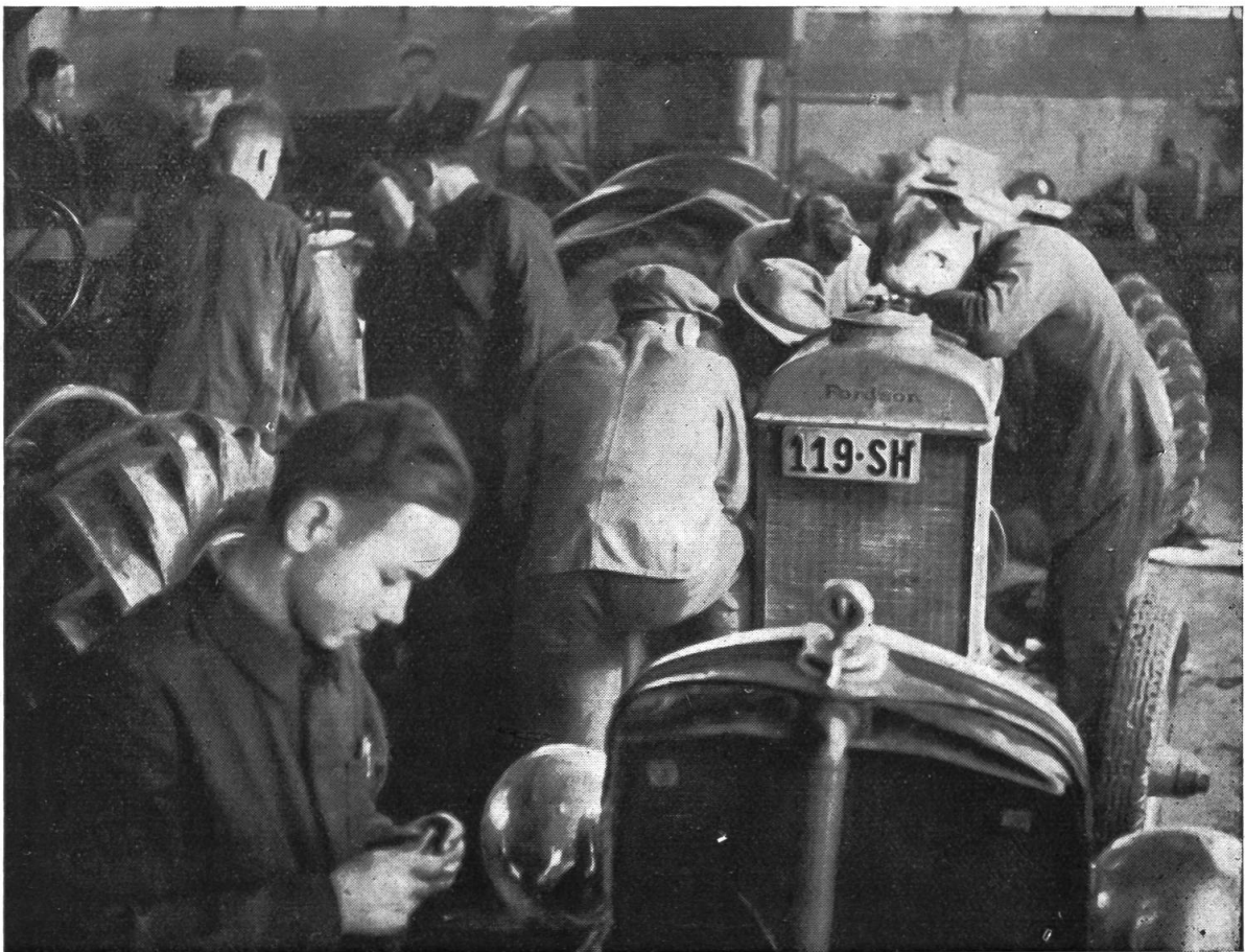
Rege Tätigkeit an dem von der Sektion Schaffhausen anfangs Januar durchgeführten Revisionskurs.

Das bedeutende Kapital, das heute in einem Traktor investiert werden muss, beantwortet diese Frage von selbst. Es handelt sich einfach darum, ob man es sich leisten kann, ein solches Kapital ohne Versicherungsschutz den ständig lauenden Unfallgefahren auszusetzen oder nicht. Die Prämien, die heute für eine Traktor-Kaskoversicherung bezahlt werden müssen, sind unbedingt tragbar. Vor allem wenn wir uns an den eben bei der Unfallversicherung aufgestellten Grundsatz halten, das Hauptgewicht auf den grossen, die Existenz des Betriebes gefährdenden Schaden beschränken. Indem wir einen sogenannten Selbstanteil in die Versicherung aufnehmen, sind die Prämien im Verhältnis zum Risiko geradezu bescheiden. Auch hier kann man sagen, dass der Traktorbesitzer das Kaskorisiko nicht selbst tragen sollte.