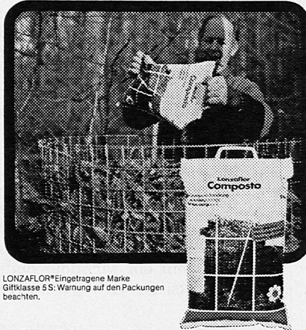
LONZAFLOR® eingetragene Marke Giftklasse 5 S: Warnung auf den Packungen beachten.

Das bewährte granuliert Kompostierungsmittel, das alle Gartenabfälle, Laub, Gras und die pflanzlichen Küchenabfälle kurzfristig in hochwertigen Humus verwandelt. Ein nützliches Produkt, das gerade heute in keinem Garten fehlen sollte.