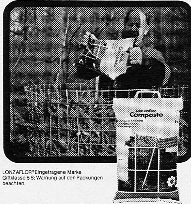
LONZAFLOR® eingetragene Marke Giftklasse 5 S: Warnung auf den Packungen beachten.

Das bewährte granuliert Kompostierungsmittel, das alle Gartenabfälle, Laub, Gras und die pflanzlichen Küchenabfälle kurzfristig in hochwertigen Humus verwandelt. Ein nützliches Produkt, das gerade heute in keinem Garten fehlen sollte.