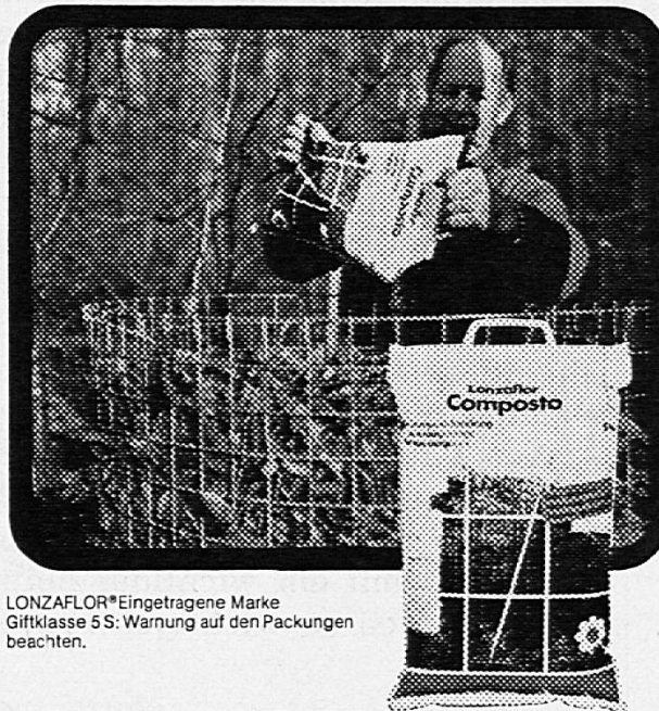
LONZAFLOR® eingetragene Marke Giftklasse 5 S: Warnung auf den Packungen beachten.

Das bewährte granuliert Kompostierungsmittel, das alle Gartenabfälle, Laub, Gras und die pflanzlichen Küchenabfälle kurzfristig in hochwertigen Humus verwandelt. Ein nützliches Produkt, das gerade heute in keinem Garten fehlen sollte.