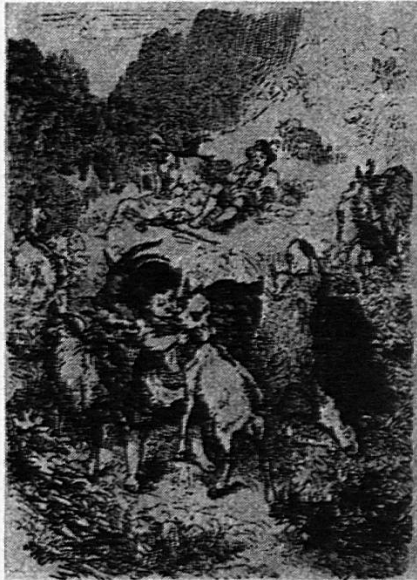
Aus den ersten Illustrationen zu «Heidis Lehr- und Wanderjahre» von Prof. Wilhelm Pfeiffer.

Erzählstoff: Kapitel 1 und 2. Zum Alp-Ohl hinauf. Beim Grossvater.