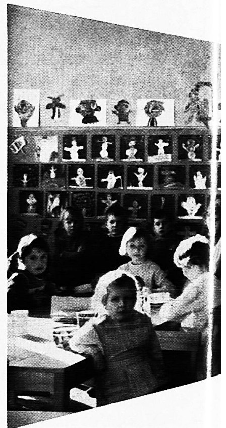
Mobiliar für Kindergärten

mit der 10-Jahres-Garantie für dauerhaften Schreibbelag und den Vorteilen: Angenehmes, weiches, blendungsfreies Schreiben und Zeichnen auf graugrün und schattenschwarzen, magnethaftenden und kratzfesten Flächen, die leicht zu reinigen sind.