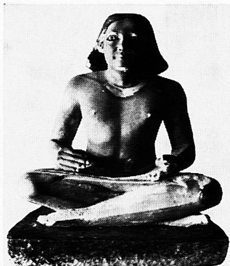
Das Ägyptische Museum Kairo

Kümmerly & Frey Geographischer Verlag Bern