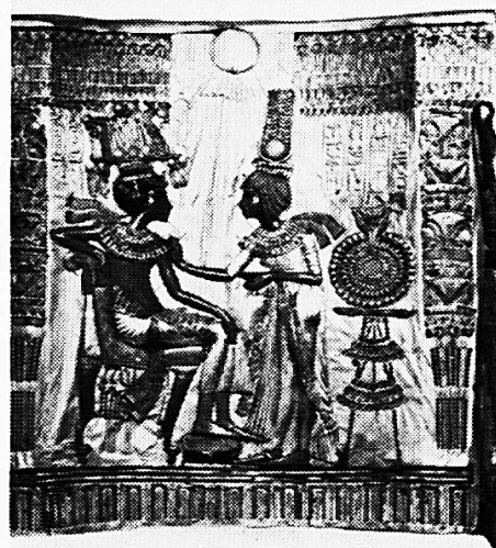
Das Ägyptische Museum Kairo