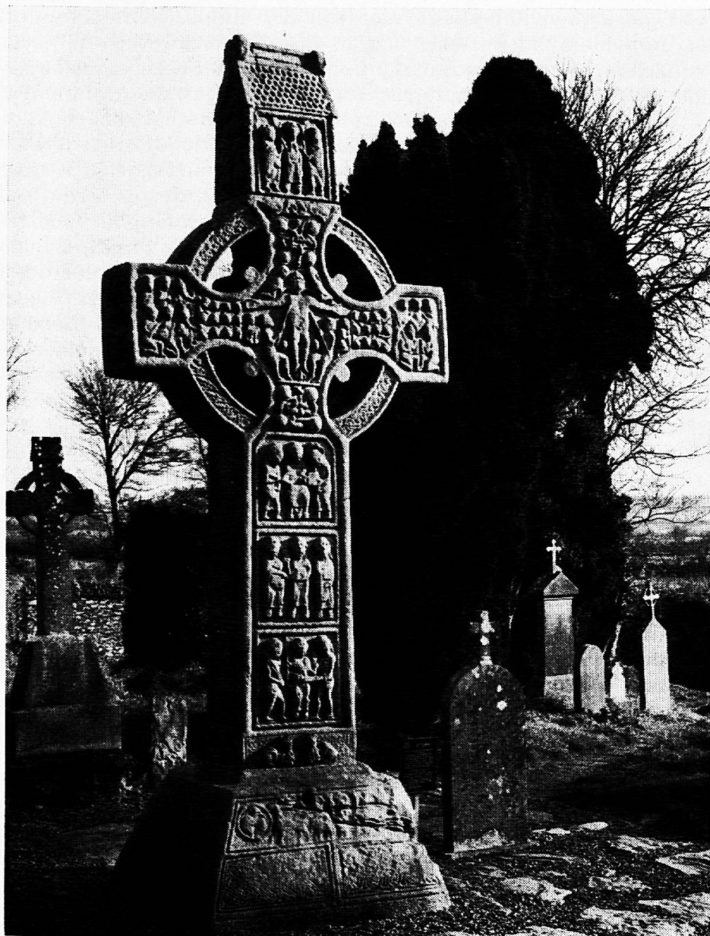
Steinkreuz, geschaffen zwischen 880 und 920, beim ehemaligen Kloster von Monasterboice

Die magische Gewalt dieser Röschen und Käthchen über «Paddys» Herz, seine romantische Bereitschaft, für sie zu leben und zu sterben, ist nur ver-