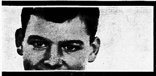
Talens & Sohn AG Olten

Mit einem TALENS-Farbkasten werden die Kinder zu begeisterten Malern