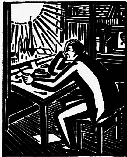
Verkl. Abb. aus Masereel, «Die Sonne»