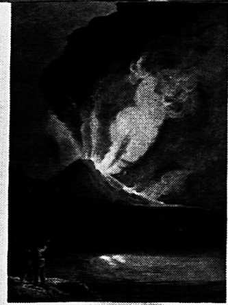
Vulkane und ihre Ausbrüche