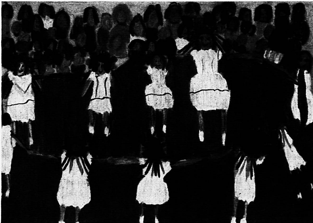
Schülerin D, S. 3. Klasse St. Gallen

... Es fing für mich nun ein Wanderleben an. Von einer Klinik in die andere, von einem Bett zum andern, bei jedem Wetter, bei jedem Weg! Ungefähr drei Jahre lang war ich Wanderschulmeister.