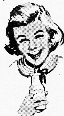
PZM / Rischik / B II

Schreiben Sie für Gratismaterial an PZM Bern (Kurzadresse genügt)