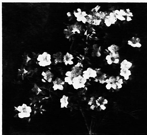
Weiße Azalee Brianza um 1882

Einsamer nie als im August Erfüllungsstunde —, im Gelände die roten und die goldnen Brände, doch wo ist deiner Gärten Lust?