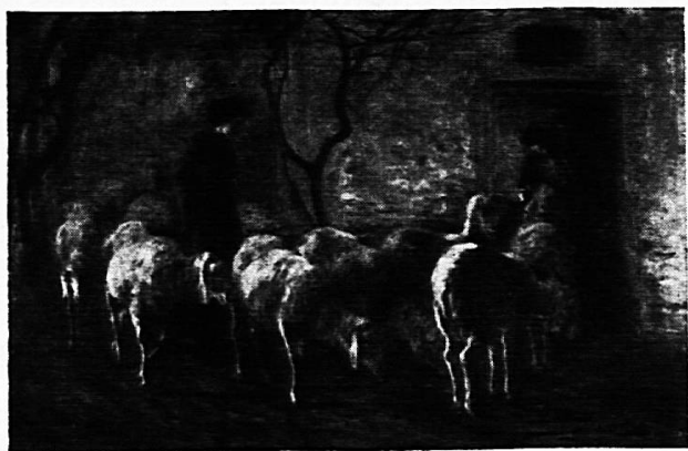
Rückkehr zum Schafstall, Brianza 1883