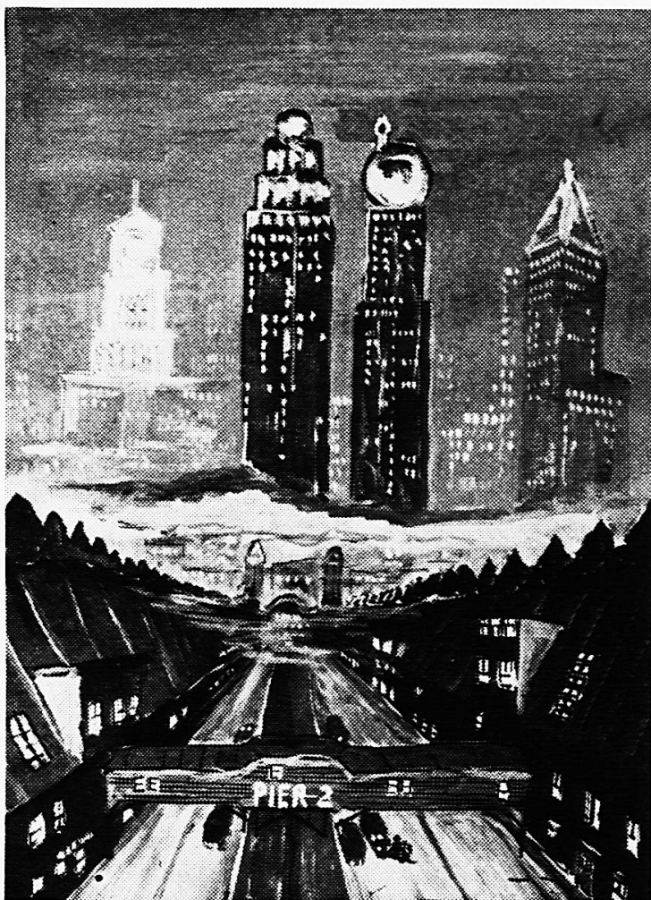
Knabe, 16 Jahre, USA Chicago Deckfarben auf Papier (Pestalozzianum Zürich)

Jahren ein wahrer Farbausbruch stattgefunden hätte und als ob nichts anderes als Farbe zu schönen und guten Bildern verhelfe. Ja es ist eine Befreiung zur Farbe geschehen innerhalb kurzer Zeit, und jeder Lehrer wird heute seinen Schülern gerne die Möglichkeit bieten, dieses Mittel zu benützen, denn das Kind hat eine unmittelbare, gefühlsbetonte Beziehung zur Farbe und wird sich ihrer auch in diesem Sinne bedienen. Auch liefern die Farbfabriken neue, farbkräftige Produkte, so daß dem Kinde gemäßes Material beschafft werden kann. Aus dieser neuen Freude heraus ist die Kollektion für Lund so farbenfroh beschickt worden. Unmöglich ist es, die einzelnen Gruppen zu schildern, geschweige denn einzelne Arbeiten hervorzuheben. Jeder Besucher wird die Bilder nach seinen Gesichts-