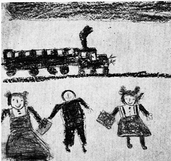
7 Jahre, Norwegen, Lofoten Reisende Farbstift auf Papier