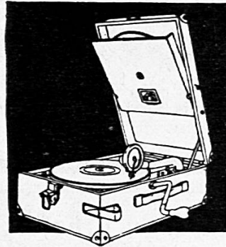
Reiseapparat Fr. 190.—

auf der Reise, an den Badestrand, im Auto zum Weekend oder zu lieben Freunden. Überall bringt er Frohsinn und Genuss, der kleine „His Master's Voice“. Auch im Freien klingt sein Spiel klar und kräftig.