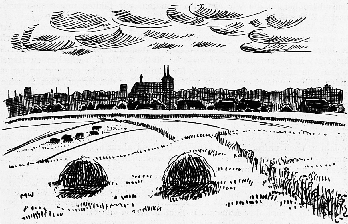
Stadt und Dom von Roskilde