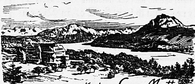
Kurhaus Sonn-Matt Luzern. 600 M. ü. M.

Français. / Toutes branches ménagères. (Près Neuchâtel) 632