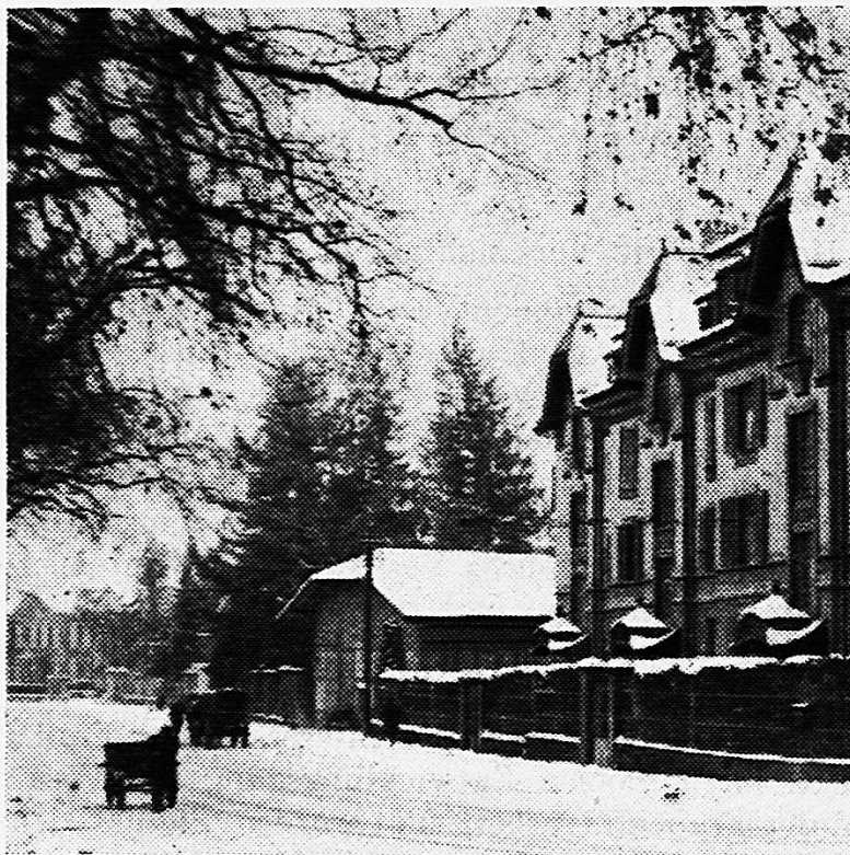
Wohnhaus während den Jahren der stärksten öffentlichen Tätigkeit an der Laupenstrasse 51, Bern. 1916/17 ständiges Sekretariat des Aktionskomitees zur Erlangung des Frauenstimmrechts in Gemeindeangelegenheiten.