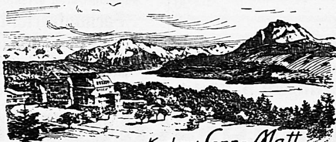
Kurhaus Sonn-Matt Luzern. 600 M. M.

Français. / Toutes branches ménagères. (Près Neuchâtel) 632