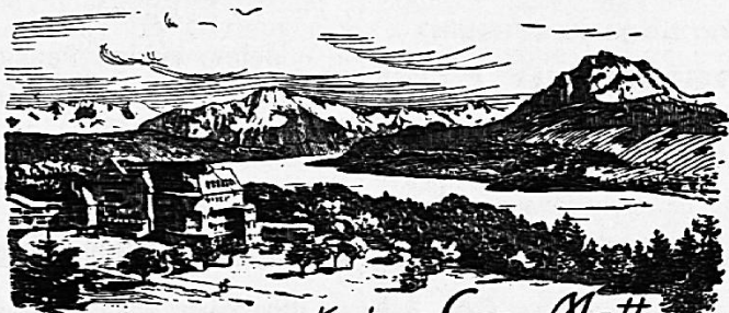
Kuchhaus Sonn-Matt Luzern. 600 M. u. M.

Eine Reise nach Paris und London, humoristisch-satirische Verse. 156 Seiten mit 40 Künstlerkarikaturen. Preis nur Fr. 2.50.