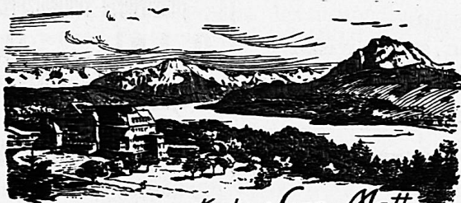
Kurhaus Sonn-Matt Luzern. 600 M. M.