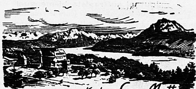
Kurhaus Sonn-Matt Luzern. 600 A.M.

Der Gemeinnützige Frauenverein der Stadt Luzern.