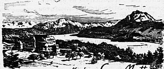
Kurhaus Sonn-Matt Luzern. 600 M. ü. M.

Sommaire du 20 mai 1927: L'Idée recule ... à Bâle, mais elle marche ... à Neuchâtel: E. Gd. — La préservation morale de la jeunesse féminine: M. H. — La question de l'alcoolisme à la Société des Nations: Jeanne Pittet. — Conseil International des Femmes: programme des réunions de Genève. — L'Association suisse pour le Suffrage féminin à Lausanne: Emma Porret. — De ci, de là. — Nouvelles de la „Saffa“ (Exposition nationale suisse du travail féminin). — Carnet de la quinzaine. — Feuilleton: La mère de Mazzini: J. V. d'après E. Werder. — Illustration: La maison de la Ligue des femmes électriques à Washington.