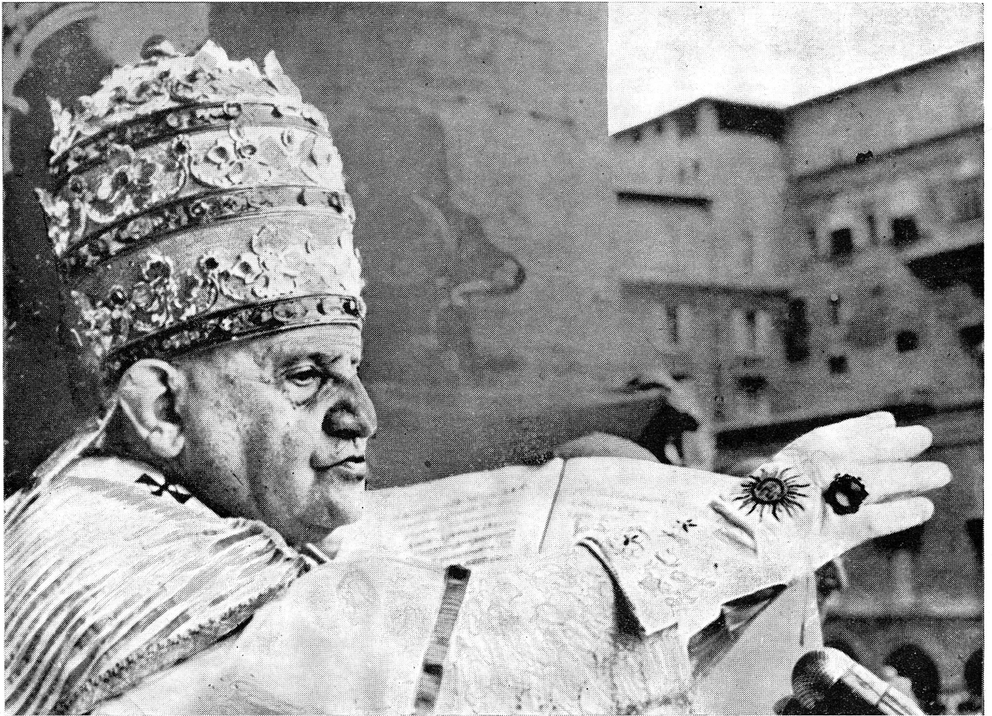
Papst Johannes XXIII. erteilt nach seiner Krönung «Urbi et Orbi» den Apostolischen Segen