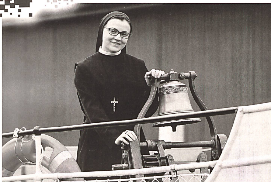
Suor Cristina