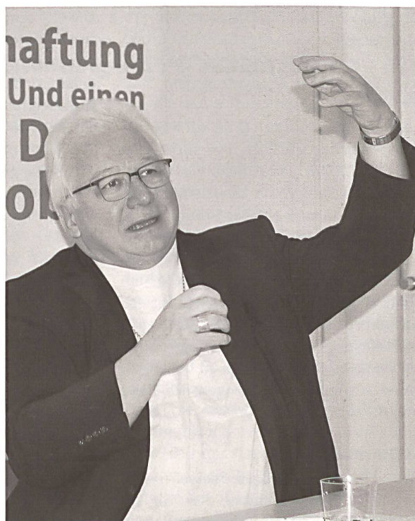
Bischof Markus Büchel

Der St. Galler Bischof und Präsident der Schweizer Bischofskonferenz Markus Büchel äusserte sich am Donnerstag, 5. Februar, an einem Mediengespräch zu aktuellen Entwicklungen in der katholischen Kirche. Es sei möglich, dass es künftig in einer Stadt nur noch zwei Eucharistiefeiern pro Wochenende gebe. Zum Vergleich: Laut Angaben des Bischofs wird heute an einem Wochenende in der Stadt St. Gallen an 20 verschiedenen Orten eine Eucharistiefeier angeboten. (bal)