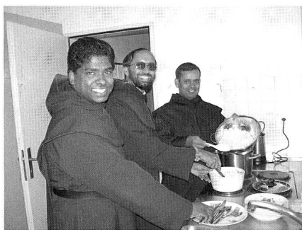
Die drei indischen Karmeliter in ihrer Basler klösterlichen Gemeinschaft "Prophet Elias".