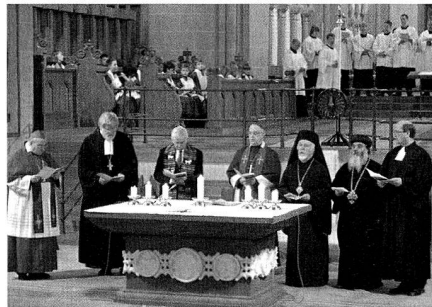
Beten für die Einheit der Christen im Paderborner Dom.

Insgesamt befindet sich die Ökumene derzeit in einem grossen Übergang, gerade die geistliche Ökumene nimmt sehr zu. Überall entwickeln sich Gebetsgemeinschaften zwischen Bischöfen, Priestern, Laien, zwischen Klöstern und geistlichen Gemeinschaften. Unmittelbar nach dem Konzil gab es eine gewisse Naherwartung, die sich so nicht erfüllt