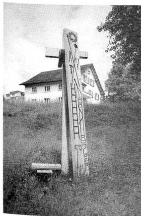
Kreuze der Gegenwart. Deutung + Vision Ausstellung im und um das Panorama Einsiedeln bis 14. Oktober 2001 (täglich 10–17 Uhr, Freitag und Samstag bis 22 Uhr).