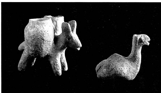
Bild: Esel, Terrakotta, 4. Jht. v. Chr., Tel Aviv

Ausstellung des Biblischen Instituts der Universität Freiburg im Zoologischen Museum der Universität Zürich bis 20. August 2000 (Dienstag bis Freitag, 9–17 Uhr; Samstag und Sonntag, 10–16 Uhr).