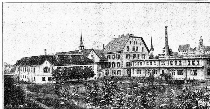
St. Joseph, Bremgarten (Aargau).