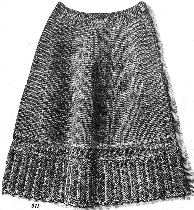
1. Gehäkelter Unterrock. Hierzu das Detail Abbildung 2.

Der Unterrock ist mit rosa Rockwolle im tunesischen Stich gehäkelt. Weiße Wolle verzieret ihn. Man arbeitet den Rock in der Weite, von unten auf, auf einem Anschlag von 290 M. (an welche später die Spitze gehäkelt wird). Man häkelt bei der siebenten hingehenden tun. Tour die Bogen mit weißer