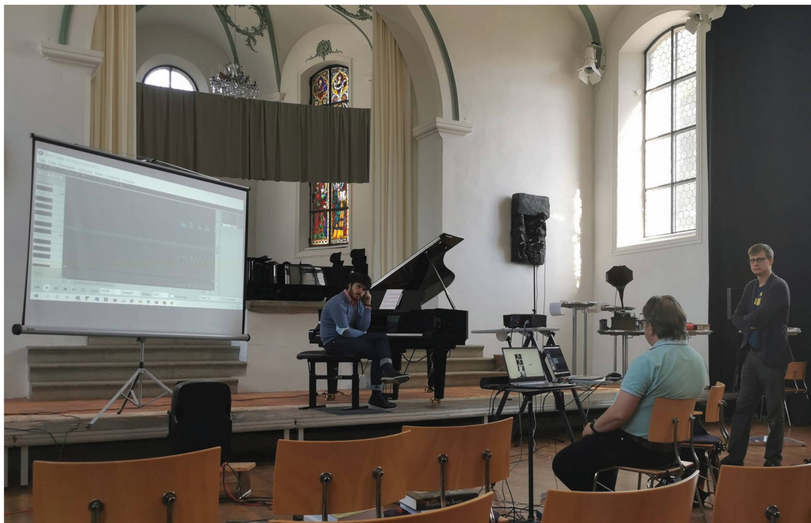
Abb. 3. Szene während eines „Magic-Piano“-Meisterkurses im Künstlerhaus Boswil, bei dem Studierende am Yamaha Disklavier mit den digitalisierten Rollenaufnahmen interagieren konnten.