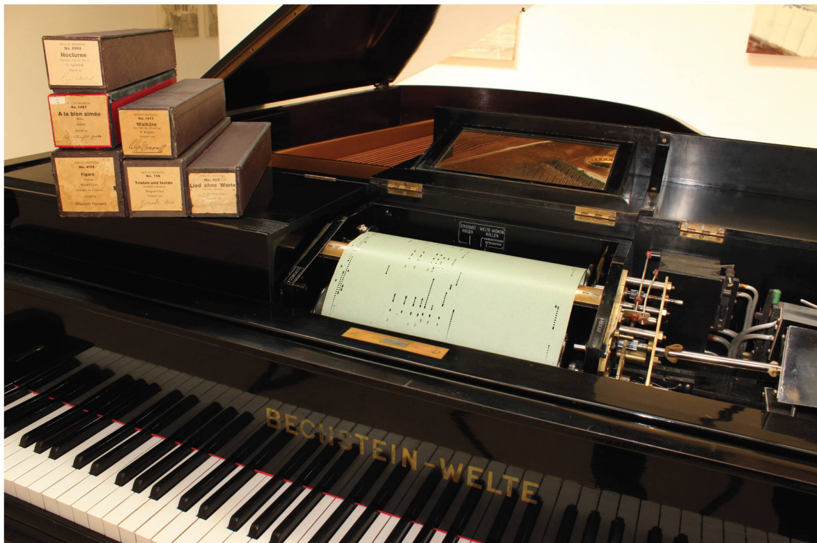
Abb. 1. Ein vorbildlich restauriertes Welte-Mignon-Instrument im Besitz von Markus Fuchs (Oetwil a. S.), das bei Veranstaltungen des Projekts zum Einsatz kommt.