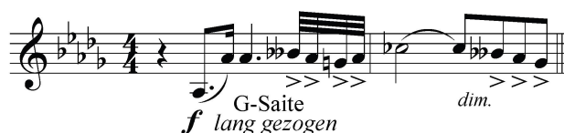
Notenbsp. 6. Gustav Mahler, Neunte Sinfonie , vierter Satz, Beginn, erste und zweite Violinen unisono.

Beide Bezüge Adornos lassen sich durch weitere motivische und harmonische Übereinstimmungen unterfüttern. In der Neunten ist beispielsweise ein konkreter intertextueller Bezug zu Wagners Parsifal auszumachen: Der vierte Satz hebt an mit einem Motiv, welches dem Blickmotiv frappant ähnelt (siehe die Notenbsp. 6 und 7).