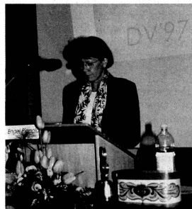
Präsidentin Käthi Engel Pignolo an der 77. Delegiertenversammlung des EO.V.

1. Der Vorstand beantragte eine Statutenänderung , die es ihm erlauben soll, statt der Herausgabe eines eigenen Mitteilungsblattes (die «Sinfonia») die Verbandsmitteilungen in einer mit anderen Musikverbänden gemeinsam herauszugebenden Zeitung zu publizieren. Die Vorteile – mehr und aktuellere Informationen aus einem grossen Bereich des musikalischen Lebens in der Schweiz – überzeugten gegenüber der Befürchtung vor einem Identitätsverlust. Durchaus ernstzunehmenden Bedenken gegenüber einer neuen, gegen 50 Seiten starken Zeitung, die 11mal jährlich allen Orchestermitgliedern zum gleichen Preis wie die «Sinfonia» zugestellt werden soll, wird der Vorstand bei der Weiterbearbeitung des Geschäftes allerdings gebührend Achtung schenken.