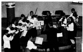
Camerata Giovanile della Svizzera Italiana in Zofingen