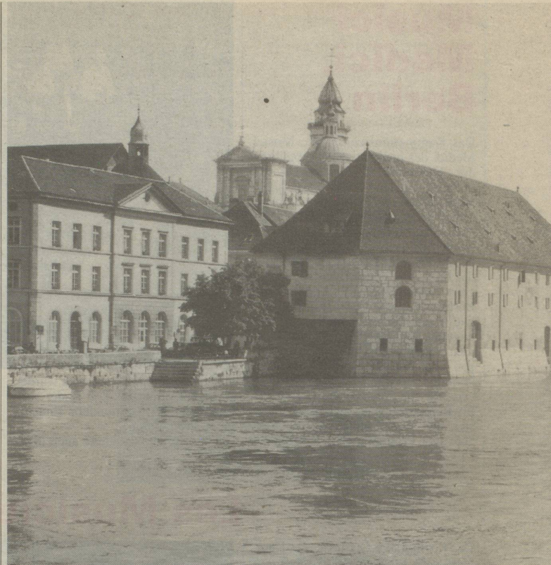
Auskunft, Informationen: Veranstaltungsbüro im Landhaus Solothurn, ab 13. Juni 1991, 14 Uhr. Telefon 065 - 23 41 05.