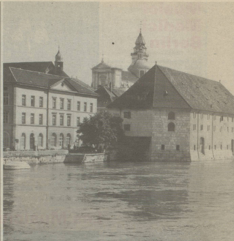
Auskunft, Informationen: Veranstaltungsbüro im Landhaus Solothurn, ab 13. Juni 1991, 14 Uhr. Telefon 065 - 23 41 05.