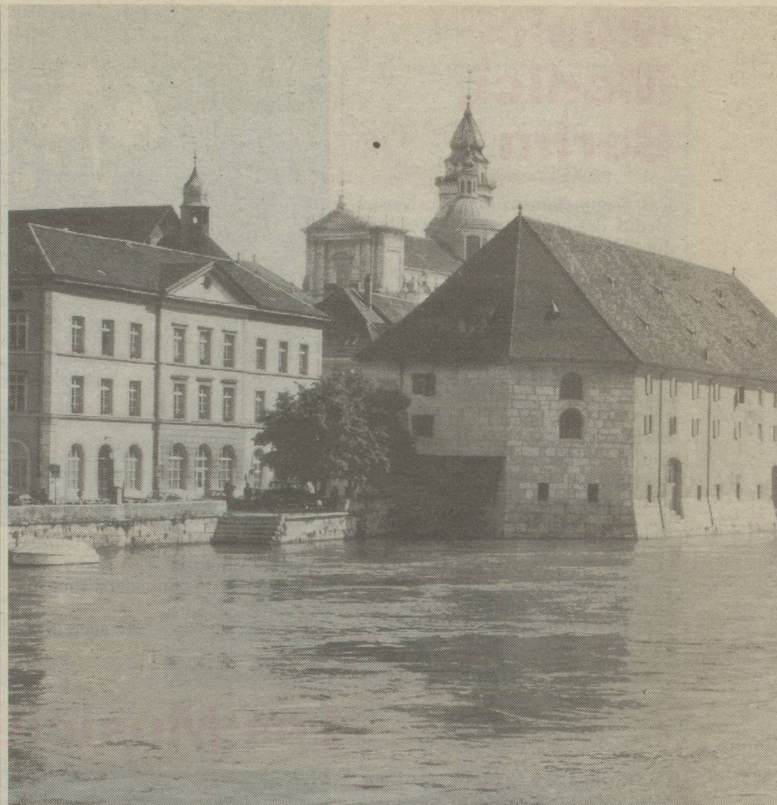
Auskunft, Informationen: Veranstaltungsbüro im Landhaus Solothurn, ab 13. Juni 1991, 14 Uhr. Telefon 065 - 23 41 05.