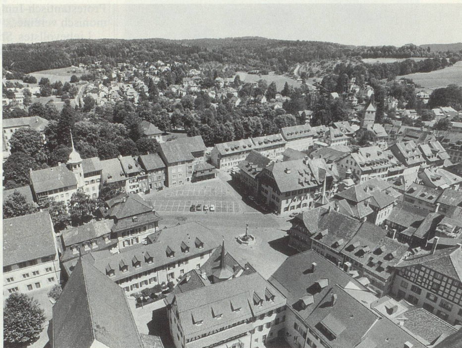
Am 5. Mai erwartet der EOv seine Mitglieder und Gäste zur 70. Delegiertenversammlung im malerischen Zofingen. – Samedi 5 mai, rendez-vous à la pittoresque bourgade de Zofingue, où la SFO organise sa 70e Assemblée des délégués.