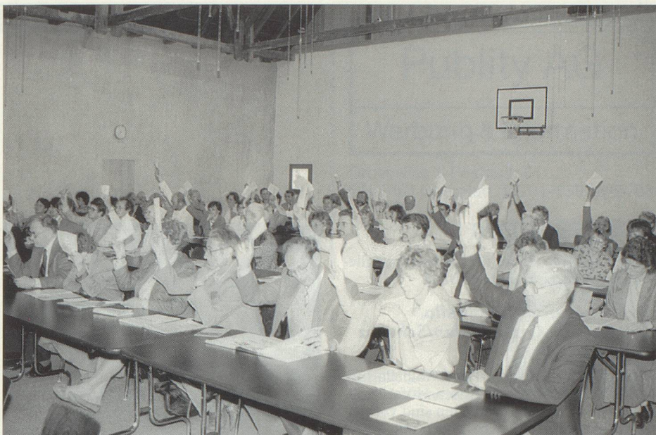
Auch an der diesjährigen Delegiertenversammlung wird über wichtige Fragen abgestimmt. Les délégués s'intéressent aux questions qui décident de l'avenir de la société.

Dans l'exercice de nos fonctions, nous avons vérifié les comptes annuels 1989 de la Société fédérale des orchestres. Nous constatons que