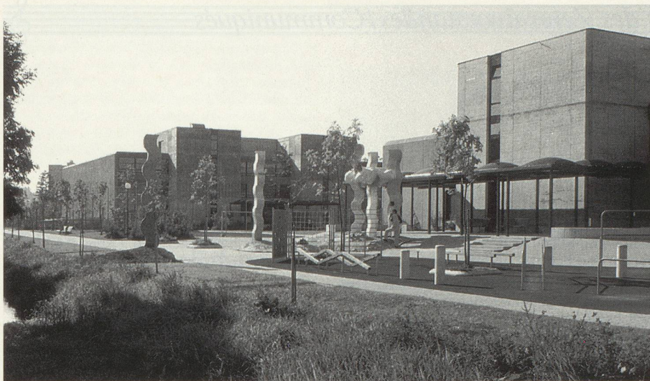
Die Tagung «Jugend- und Schulorchester in der Schweiz» ist im Bildungszentrum Zofingen angesagt. La conférence-débat concernant les orchestres de jeunes se tiendra au Centre culturel de Zofingue.