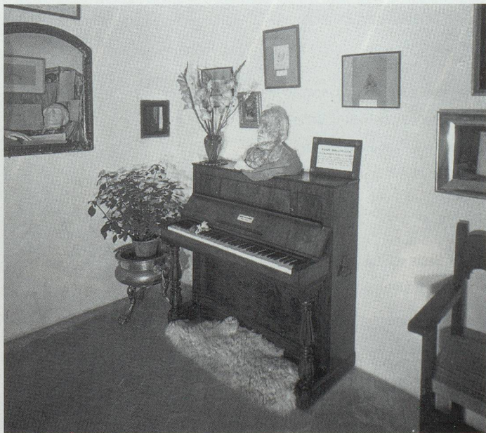
Neben dem mehrstündigen Üben blieb auch Zeit, sich auf den Inseln umzusehen. In Vall de Mosa gibt es zum Beispiel das Mallorcinische Klavier von Chopin.